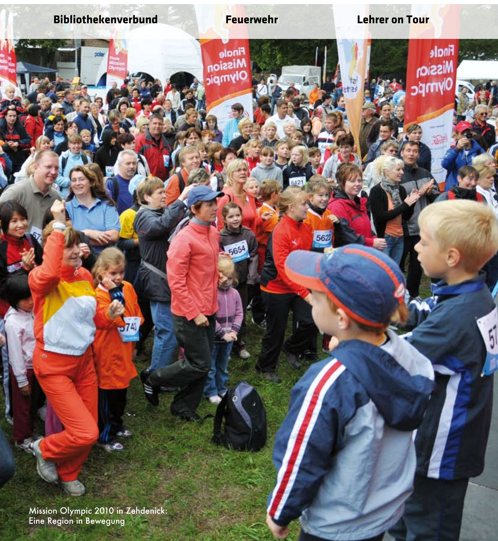
Mission Olympic 2010 in Zehdenick: Eine Region in Bewegung